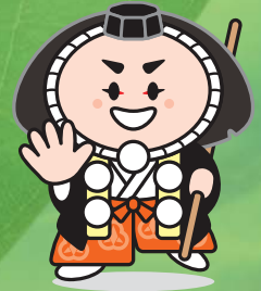
小松市イメージキャラクター「カブッキー」